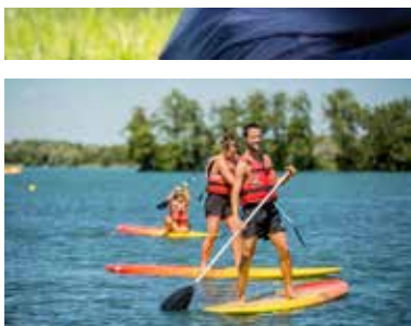
PLAGE ET ACTIVITÉS