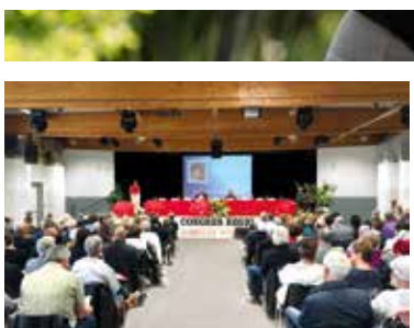
LOCATION DE SALLES